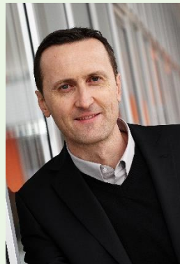
DI Marcus Deopito Wohnbaugruppe ENNSTAL/ENW

Bereich Gesundheit, Klima, Sharing, MaaS