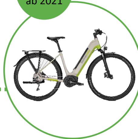
TRB 28" Bosch Intuber Uni