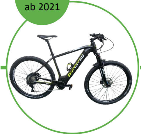
Pyramid Intube 29" XS - XL